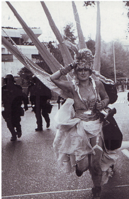
"Reclaim the Streets & Pink Silver Brigades", Angleterre. Image extraite de "We are everywhere" éd. Verso, 2003.