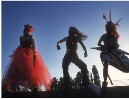
Reclaim the Streets, 'Never Mind the Ballots', 1997.