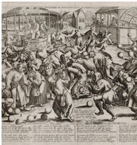
La fête des fous, estampe, P. Bruegel (1525?-1569).