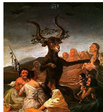
F. Goya. Le sabbat des sorcières, 1797-1798.

" Il y a des corps, des bouches, des joues, des cœurs brisés, des seins, des ventres affamés, des hanches, des cuisses, des jambes, des pieds, des bras et au bout de ces bras, il y a des mains.